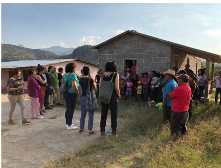
Euskal Ordezkaritza, Nuevo Amanecer nekazal elkartearekin (Tegucigalpa)

Txosten honen sarreran jaso den bezala, Honduras hartzen da munduko herrialderik arriskutsuentzat, behintzat, ingurumena, lurraldea eta guztion ondasunak (lurra, ura, ibaiak eta basoak) defendatzen dituzten pertsonentzat.