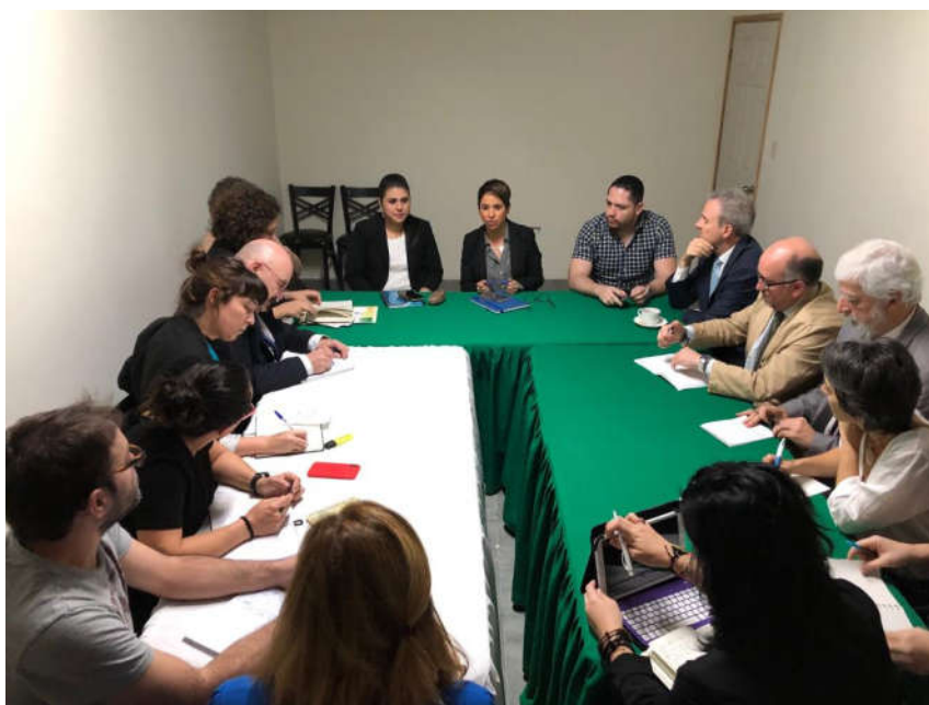
Euskal Ordezkaritza Giza Eskubideen Idazkaritzarekin bilduta, Tegucigalpa.

Onartu egin du beharrezkoa dela prebentzio-ikuspegia gehiago lantzea (eta bereziki nabarmentzen du LGTBI pertsonen egoera), eta mesfidantza handia dagoela haien lanean. Horrekin batera aipatzen du prozedura eta arauak ez direla ezagutzen, eta azpimarratu egiten du pertsona babestuen borondatek abiatzen dela prozedura.