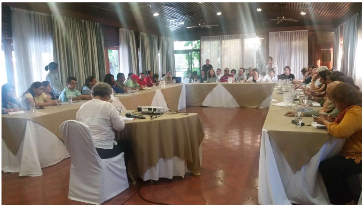
Euskal Ordezkaritza Honduraseko Giza Eskubideen Erakundeekin eta Gizarte mugimenduekin bilduta, Tegucigalpa.

Erabaki horiek hainbat lege-erreformaren bidez babestu dituzte, baina gizarte-erakunde eta -mugimendu askok, OACNUDHrekin batera, salatu egiten dituzte. Era berean, Errepublikako Kongresuko Justiziaren eta Giza Eskubideen Batzordeko kideek ere EAEko ordezkariari adierazi diete egoera horrek herritarren giza eskubideen urraketak bultzatzen dituela. Nazioarteko erakundeek adierazi dute Armadak parte hartu duela herrialdean eragina izaten duten erabakietan, besteak beste, GKEen jarduerari lotutako erabakietan. Gainera, oso kezkatuta daude segurtasun-enpresa pribatuko efektiboak nabarmen handitu direlako.