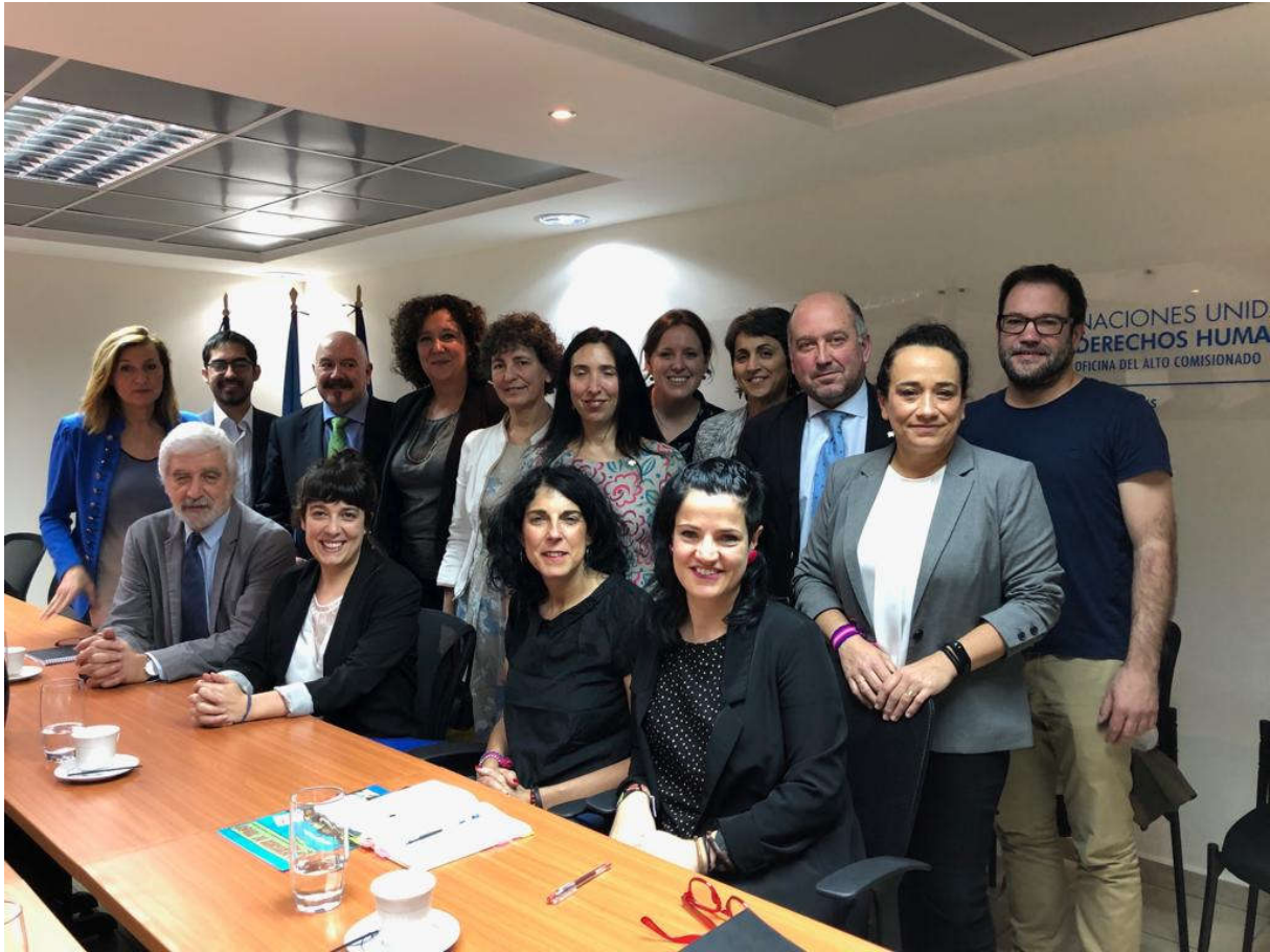
Euskal Ordezkaritza Nazio Batuen Erakundeko Giza Eskubideen mandatariaren herrialde ordezkariarekin (OACNUDH), Tegucigalpa.